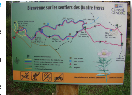
Panneau d'informations sur les sentiers