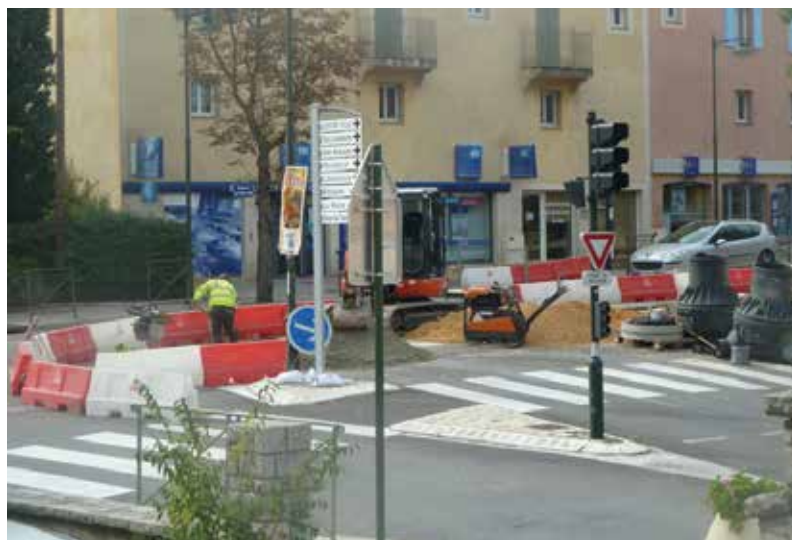
Un grand chantier préalable

Après les études nécessaires, plusieurs opérations ont été réalisées :