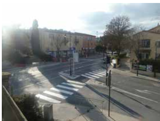
Avant : une entrée de ville confuse et difficile

En tout premier lieu et pour ne pas avoir à ré-intervenir sur une chaussée neuve, les travaux ont été anticipés et il a été convenu que le Syndicat Intercommunal à Vocation Unique Assainissement réaliserait à l'automne 2015 les changements de canalisations d'eaux usées. Une programmation particulièrement bien orchestrée !