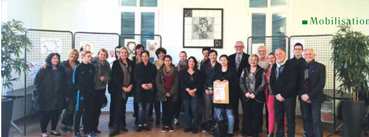
Les concurrents et le jury à l'heure des récompenses